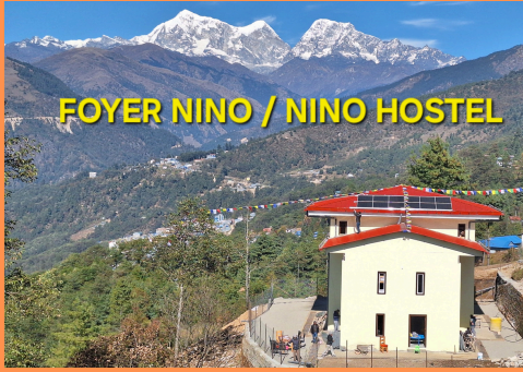
FOYER NINO / NINO HOSTEL

शेर्पा बालबालिका सहायता संघ Sherpa Children Assistance Association