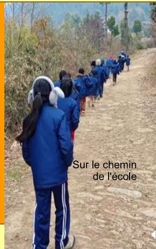
Sur le chemin de l'école