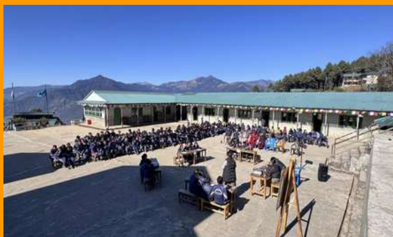
Sagarmatha secondary school