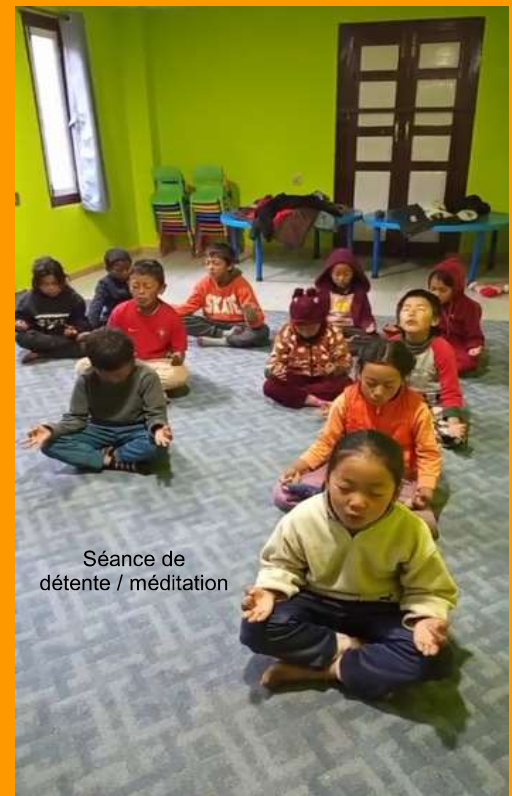
Séance de détente / méditation

5 ans - 1 enfant 6 ans - 3 enfants 7 ans - 1 enfant 8 ans - 5 enfants 9 ans - 7 enfants 10 ans - 3 enfants 12 ans - 1 enfant